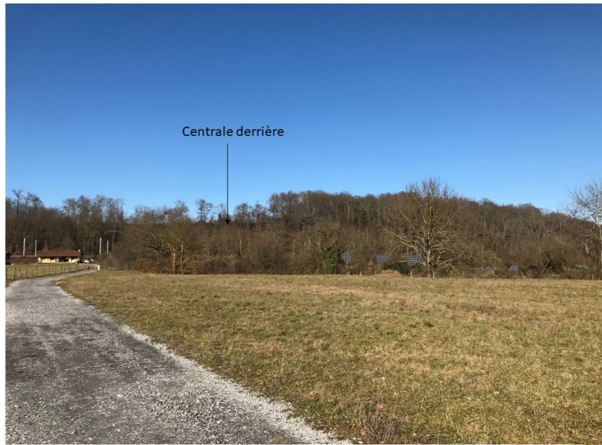
Après réalisation du projet