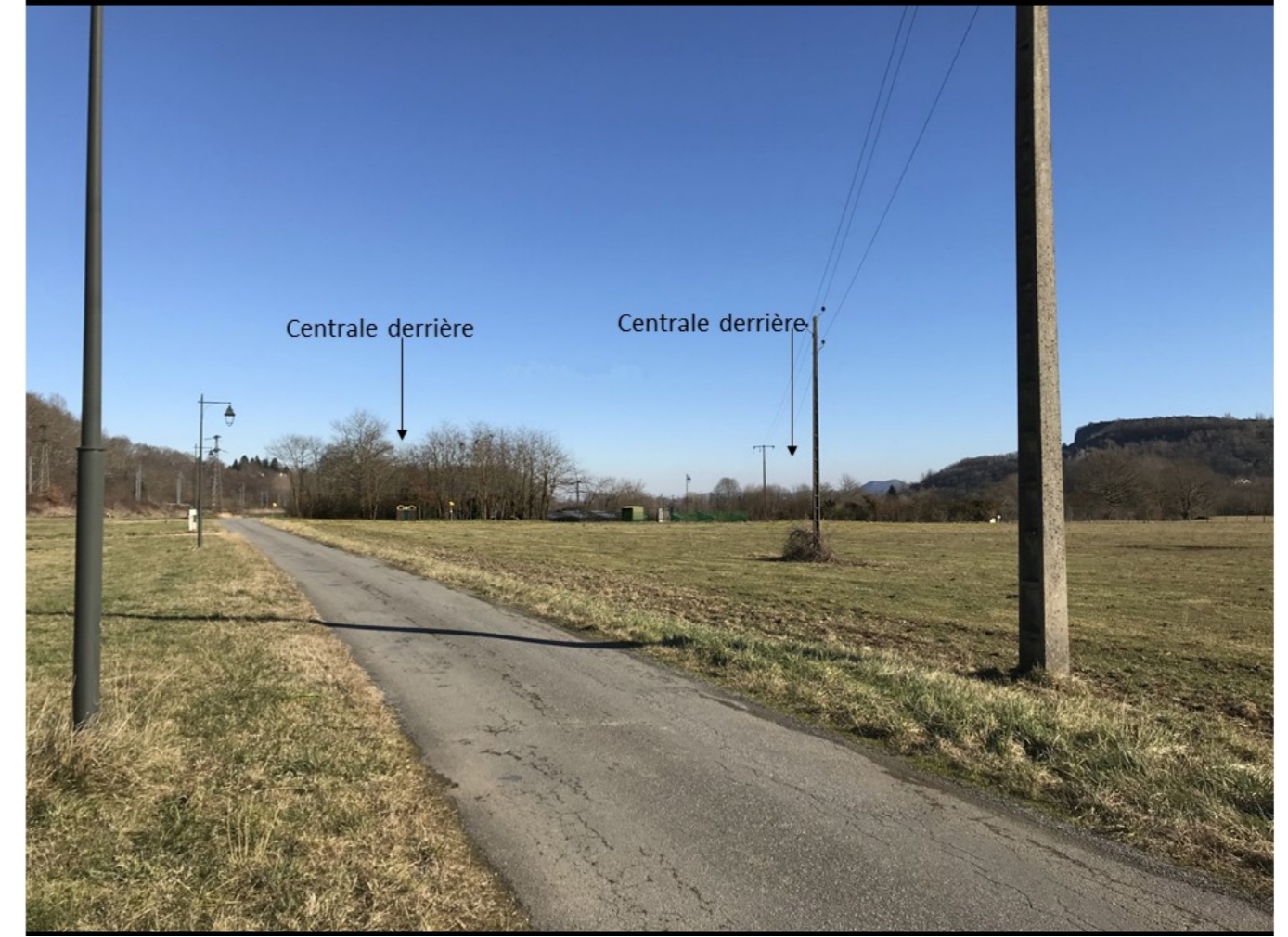
Après réalisation du projet