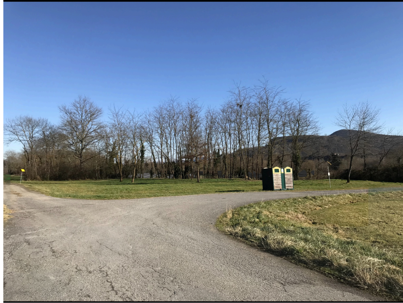
Après réalisation du projet