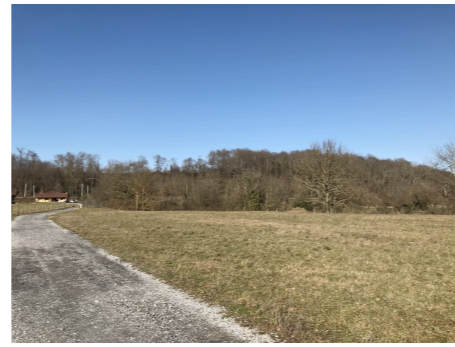
Avant réalisation du projet