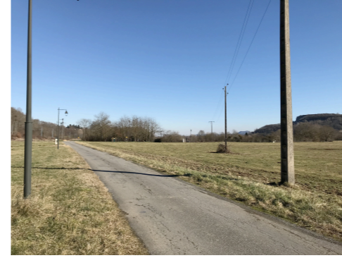
Avant réalisation du projet