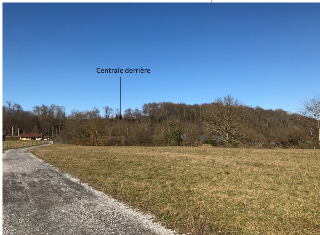
Après réalisation du projet