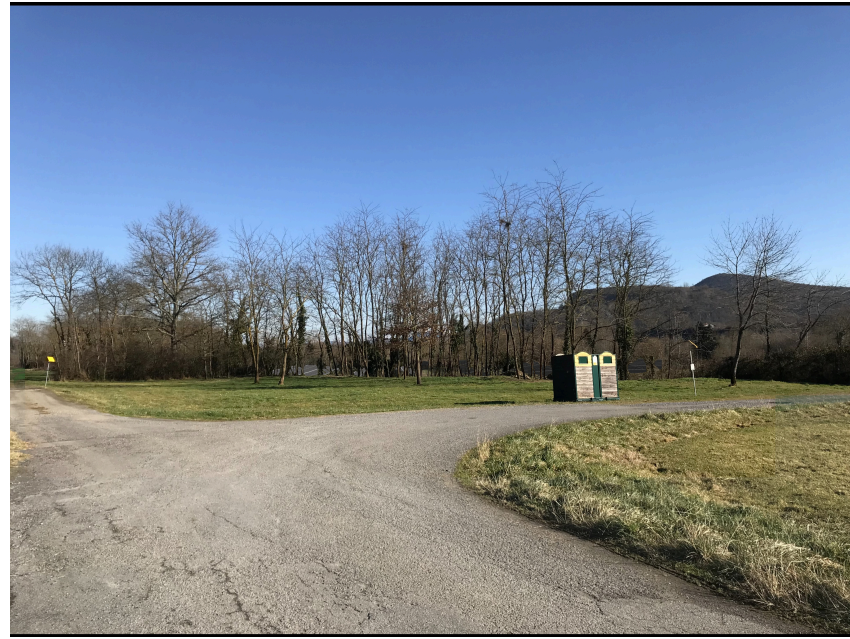
Après réalisation du projet

Insertion 2 réalisée par le Bureau CVE - vue depuis bout de la parcelle