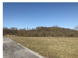
Avant réalisation du projet

Insertion 4 réalisée par le Bureau CVE - vue depuis chemin privé