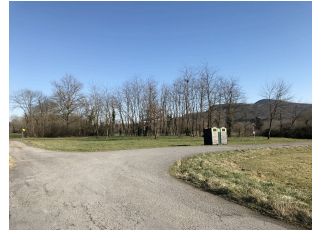
Avant réalisation du projet

Insertion 1 réalisée par le Bureau CVE - vue depuis la route