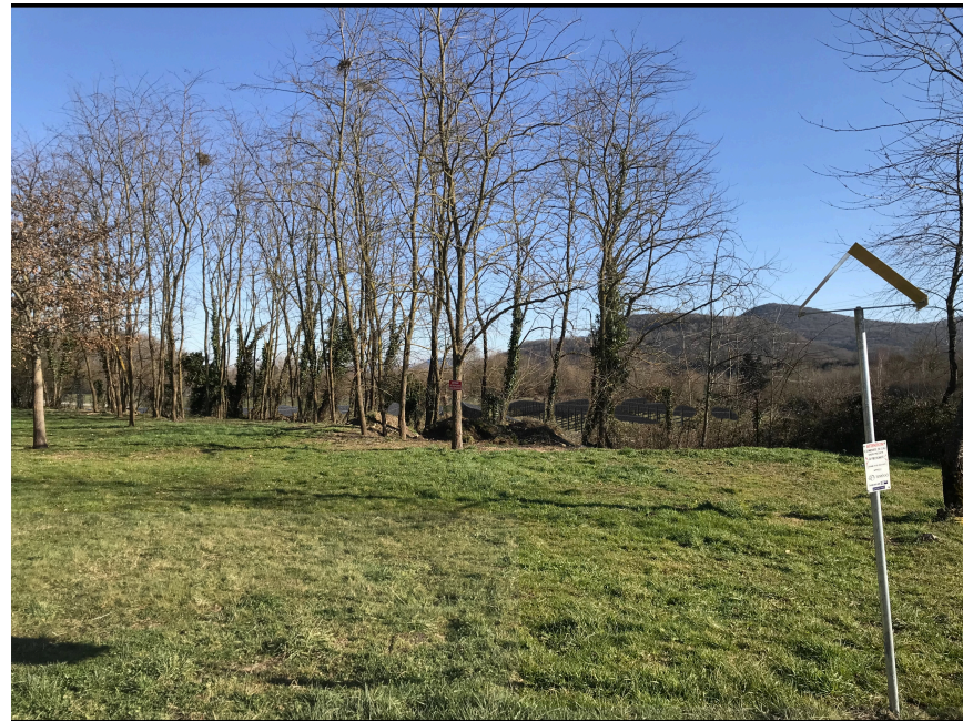
Après réalisation du projet