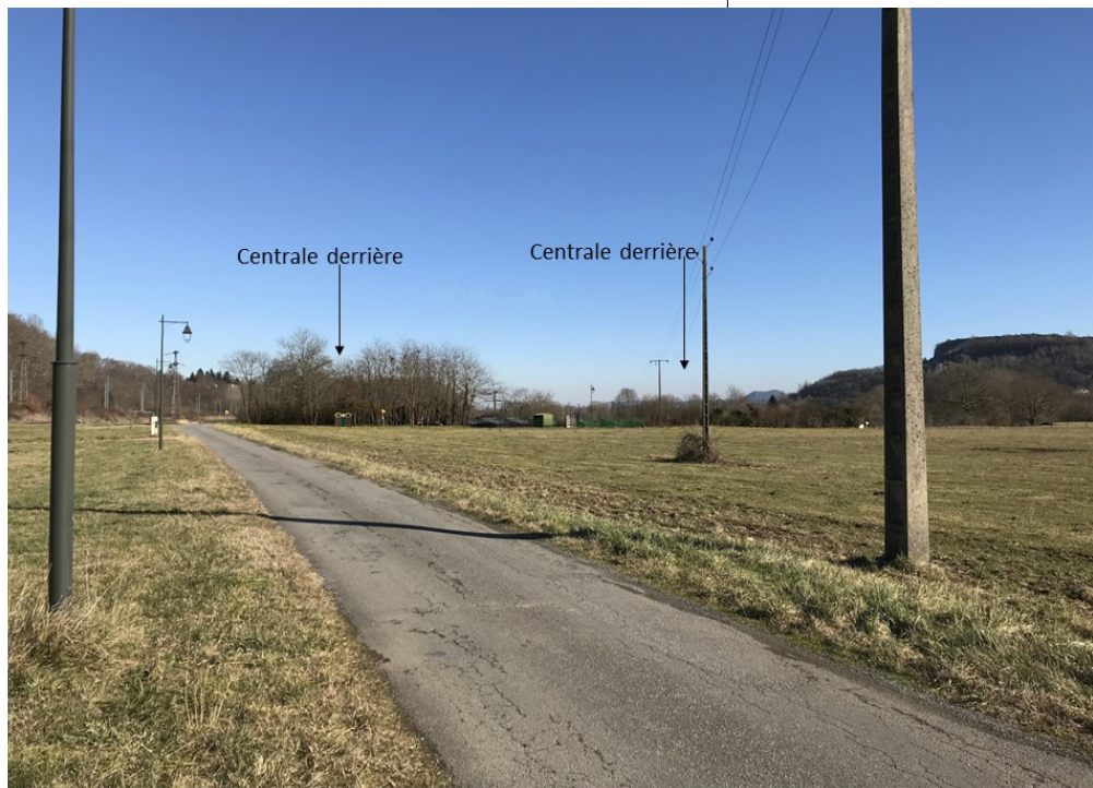
Après réalisation du projet

Insertion 4 réalisée par le Bureau CVE - vue depuis chemin privé