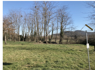
Avant réalisation du projet

Insertion 2 réalisée par le Bureau CVE - vue depuis bout de la parcelle