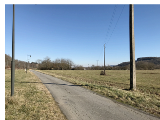
Avant réalisation du projet

Insertion 3 réalisée par le Bureau CVE - vue depuis la route