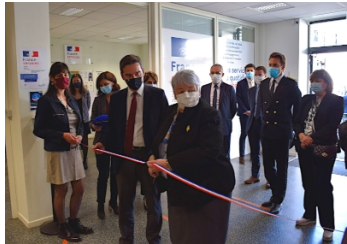
J. Gourault – Inauguration France Services Lourdes – 29 mars 2021