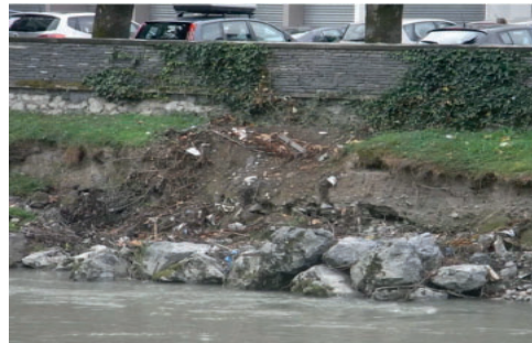
une reprise d'un enrochement de protection contre l'érosion en zone urbanisée

l'enlèvement des embâcles apportés par une crue et constituant un danger pour un ouvrage en aval lors d'une prochaine crue.