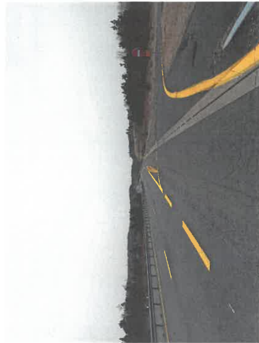
Balise posée sur fourreau