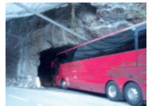
Essais de gabarit le 25/01/2017

Le Conseil Départemental est chargé de gérer le passage des véhicules de plus de 19 tonnes, de plus de 3,80 m de hauteur et des bus. Ils devront emprunter le tunnel un par un. Cela pourrait engendrer des ralentissements.